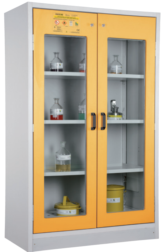
Abb.: SiS Typ 30 / 1200 GL (≥ 30 Minuten - typgeprüft)

* entfällt durch überarbeitete Fassung DIN EN 14470-1 : 2023