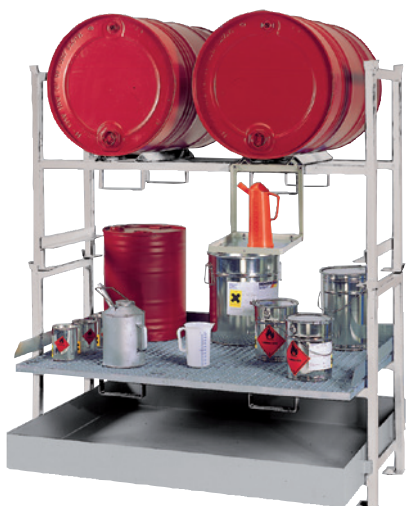
E2 mit Stapelrahmen STR-2 + STR-G und Kannenträger