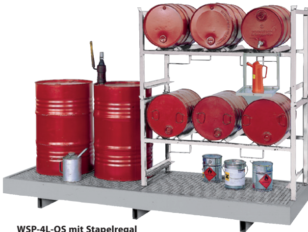
WSP-4L-OS mit Stapelregal 2 x STR-3 und Kannenträger