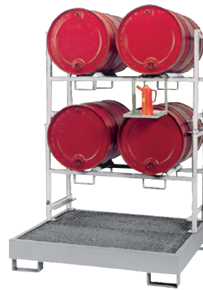
WSP-4-OS mit Stapelregal 2 x STR-2 und Kannenträger