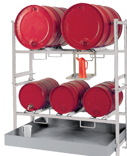
E2 mit Stapelrahmen STR-2 + STR-3, und Kannenträger