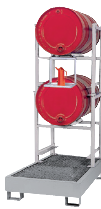
WSP-2-OS mit Stapelregal 2 x STR-1 und Kannenträger