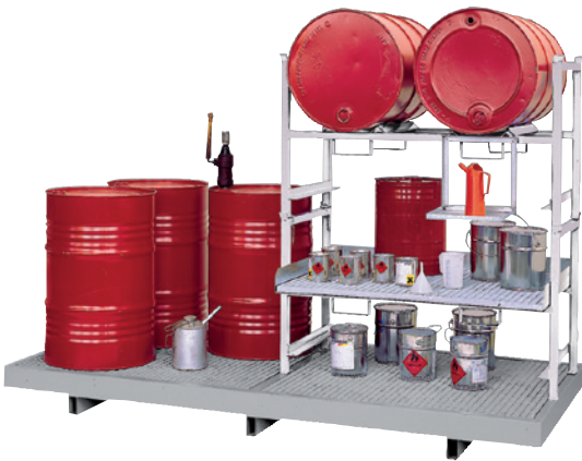
WSP-8-OS mit Stapelregal 1 x STR-G und 1 x STR-2 und Kannenträger