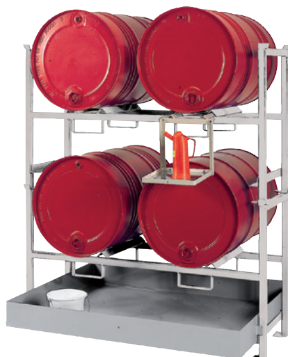
E2 mit Stapelrahmen 2 x STR-2 und Kannenträger