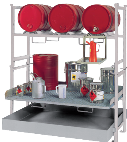
E2 mit Stapelrahmen STR-3 + STR-G und Kannenträger