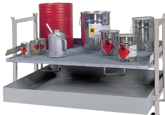
E2 mit Stapelrahmen STR-G