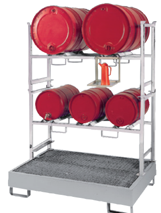
WSP-4-OS mit Stapelregal STR-2+STR-3 und Kannenträger