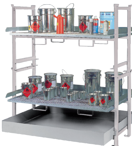
E2 mit Stapelrahmen 2 x STR-G